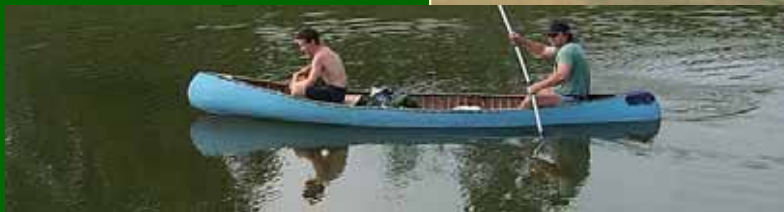
Dyjská mlýnská strouha Znojensko