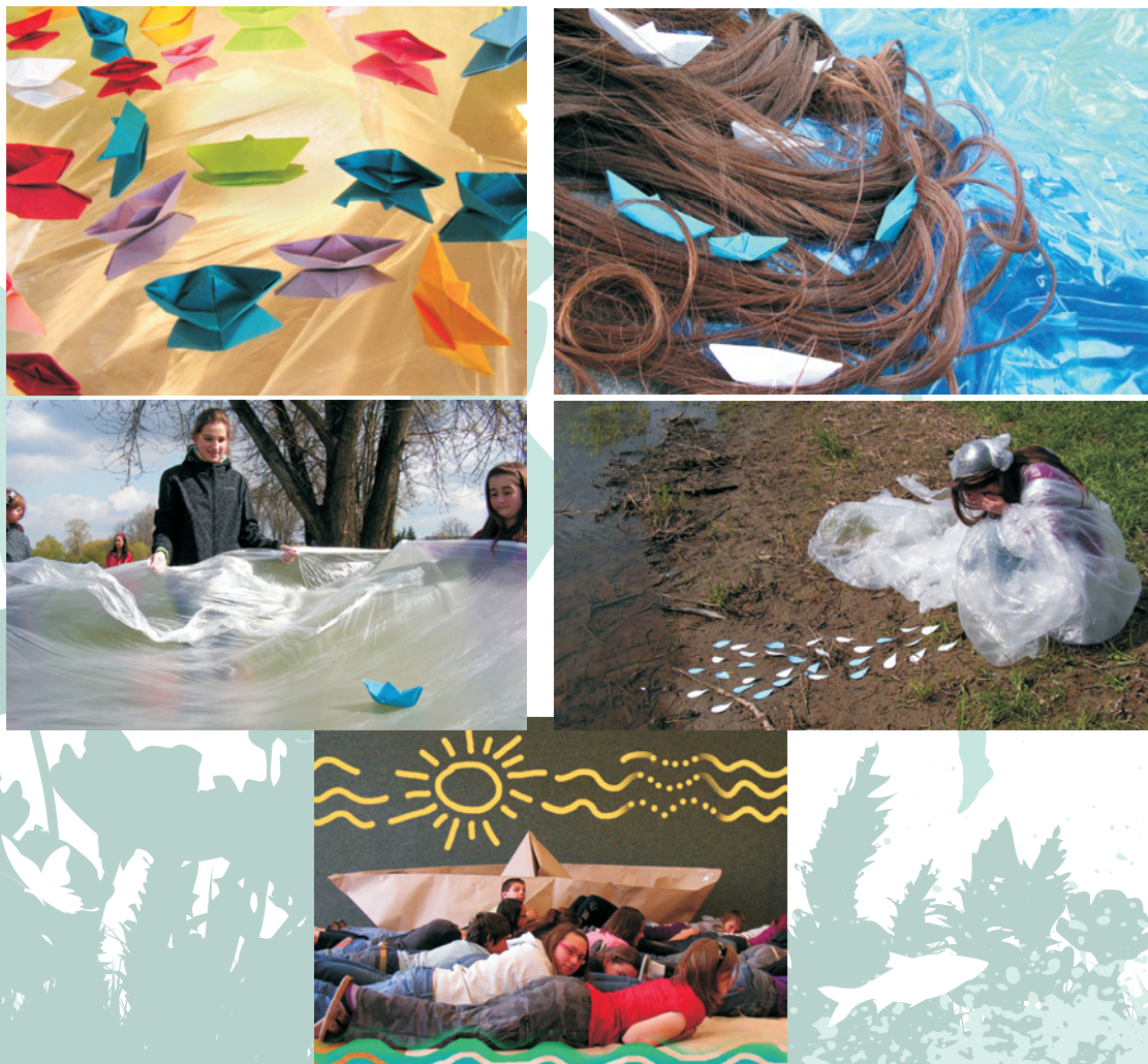
Mladí tvůrci pro Dunaj 2010 Danube Art Master